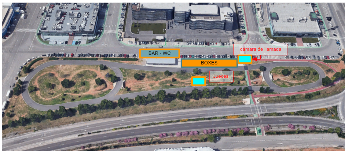
Vista aérea del circuito.

El circuito tiene una longitud de 650 metros de cuerda y una anchura de 6 m, con dos anillos cerrados (uno de 150 m y otro de 250 m). El firme es de asfalto y dispone de una recta de meta de aproximadamente 150 m con una ligera pendiente ascendente.